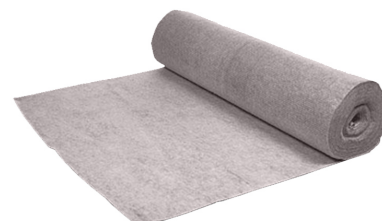
Geotextil interțesut PES100, cu densitatea 100gr/m 2