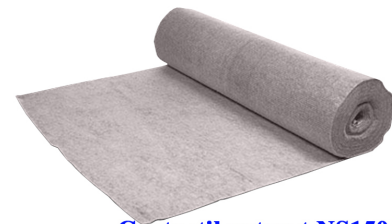
Geotextil netesut NS150, cu densitatea 150gr/m 2